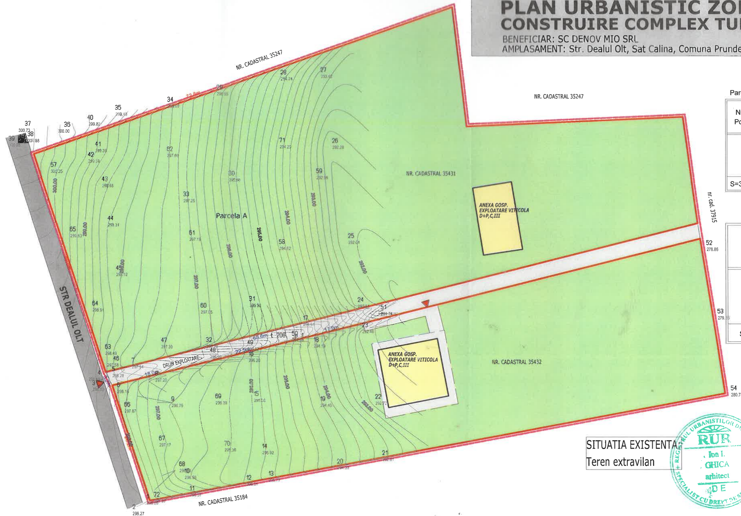
Parcela A Arabil Extravilan